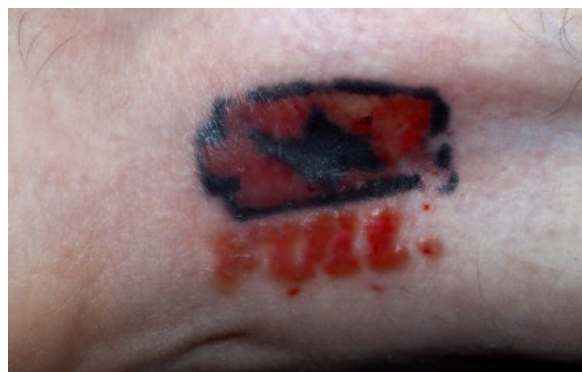
Figura 1. Reacción inflamatoria frente al pigmento rojo. Este es el responsable del 80 % de las reacciones inflamatorias frente a la tinta de los tatuajes, incluso muchos años después de realizárselo.

El aspirante a tatuarse debería saber que, entre todos ellos, el color rojo es el que puede llegar a crear más problemas de alergia o intolerancia, de forma imprevisible, tanto a corto como a largo plazo, incluso muchos años después. Hasta un 80 % de las reacciones inflamatorias que asientan sobre las tintas de los tatuajes lo hacen sobre el color rojo (fig. 1). Antaño, el pigmento rojo